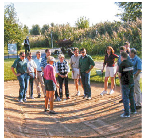
Leadership-Training mit Federal Mogul DEVA

Gesteigertes Körperbewusstsein und grundlegendes Verständnis des Zusammenhangs zwischen mentalem Zustand und körperlicher Reaktion hat tiefgreifende Auswirkungen.